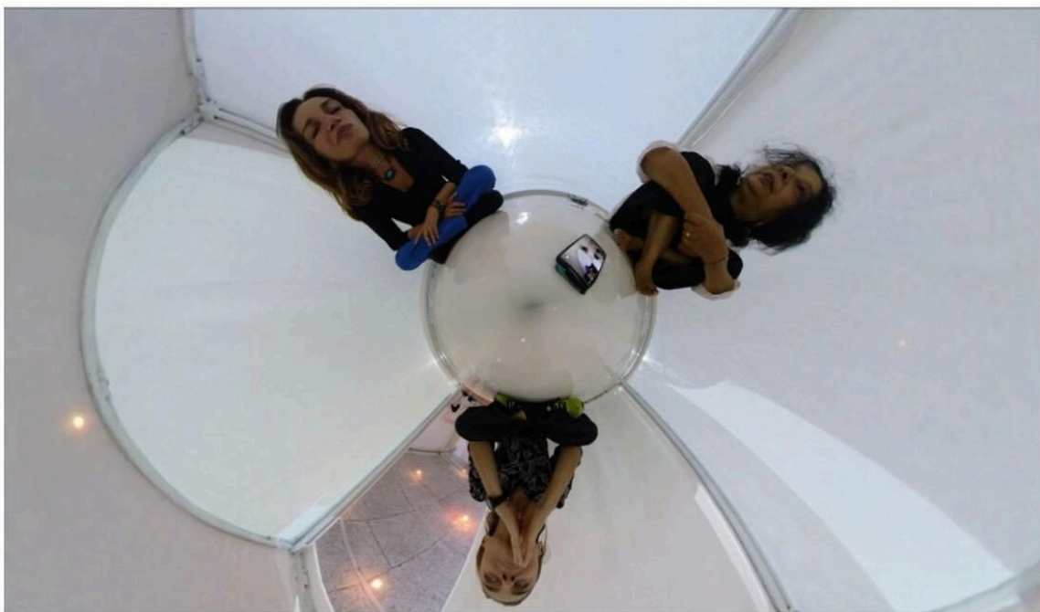
Spores - Romaeuropa Festival